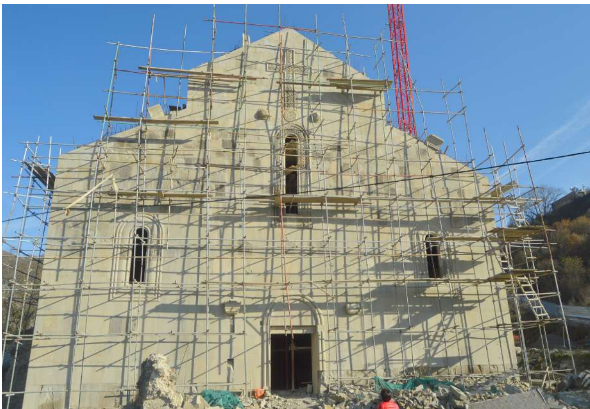
2. აწყური, კახა ხიმშიაშვილის ფოტო