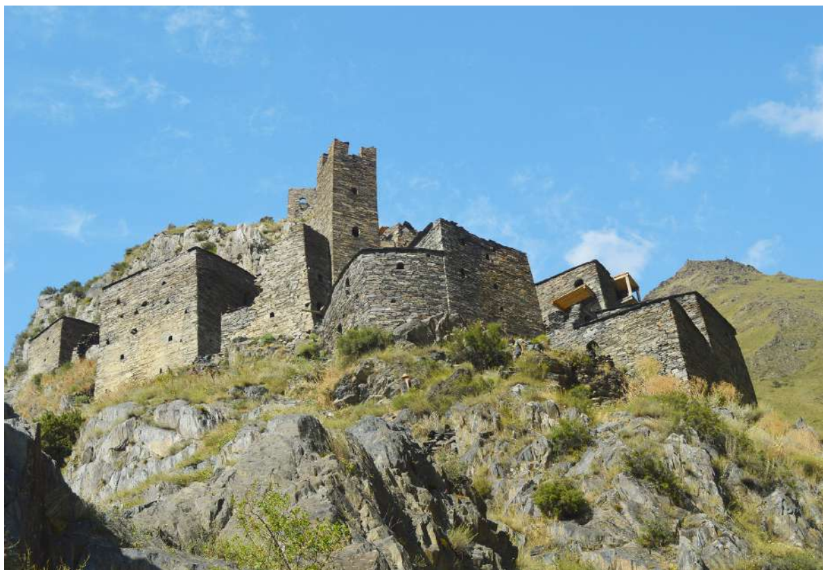
4. მუცო