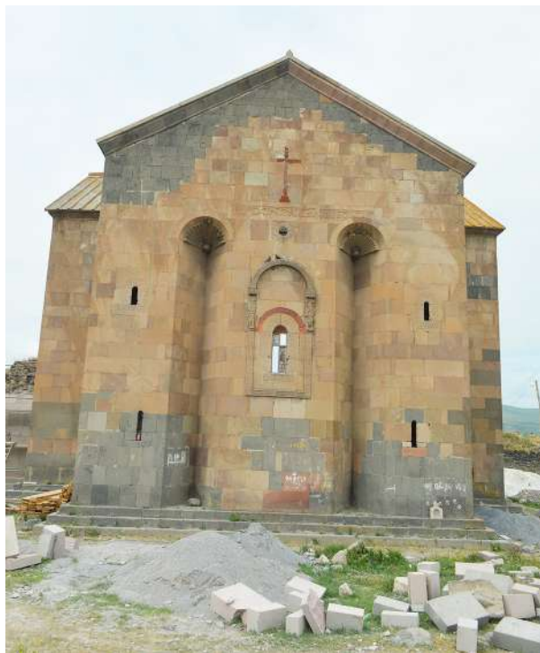
3. კუმურდო Kumurdo