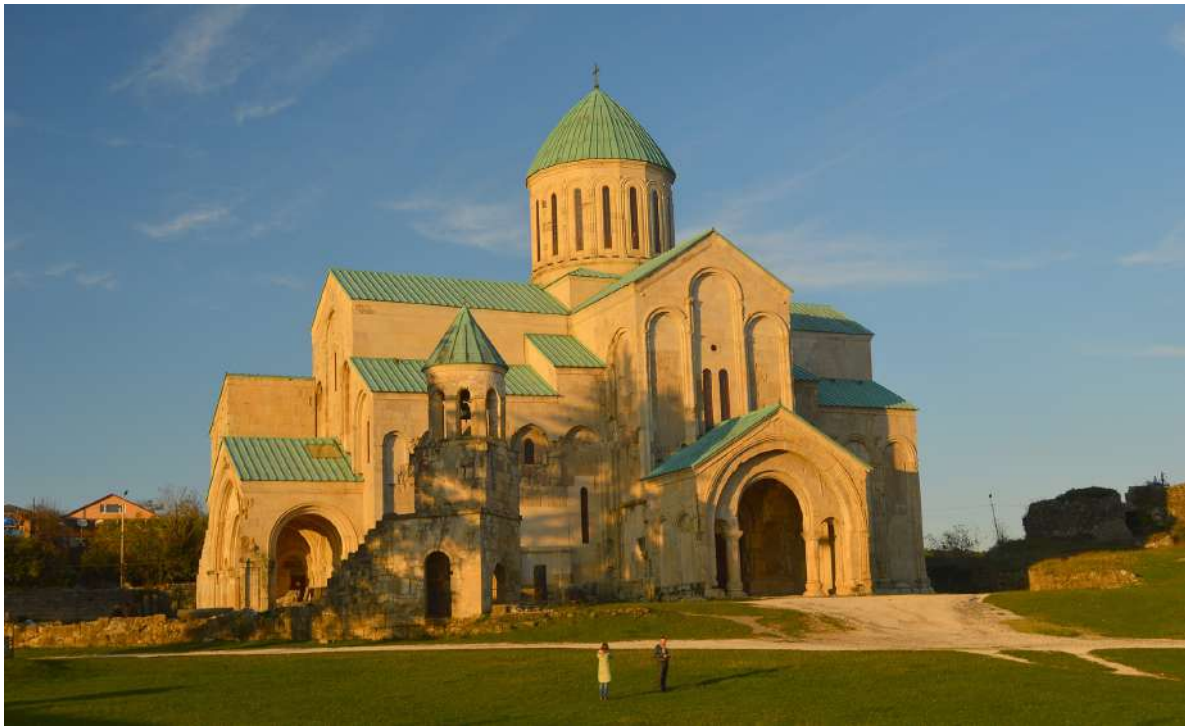
1. ბაგრატი, კახა ხიმშიაშვილის ფოტო