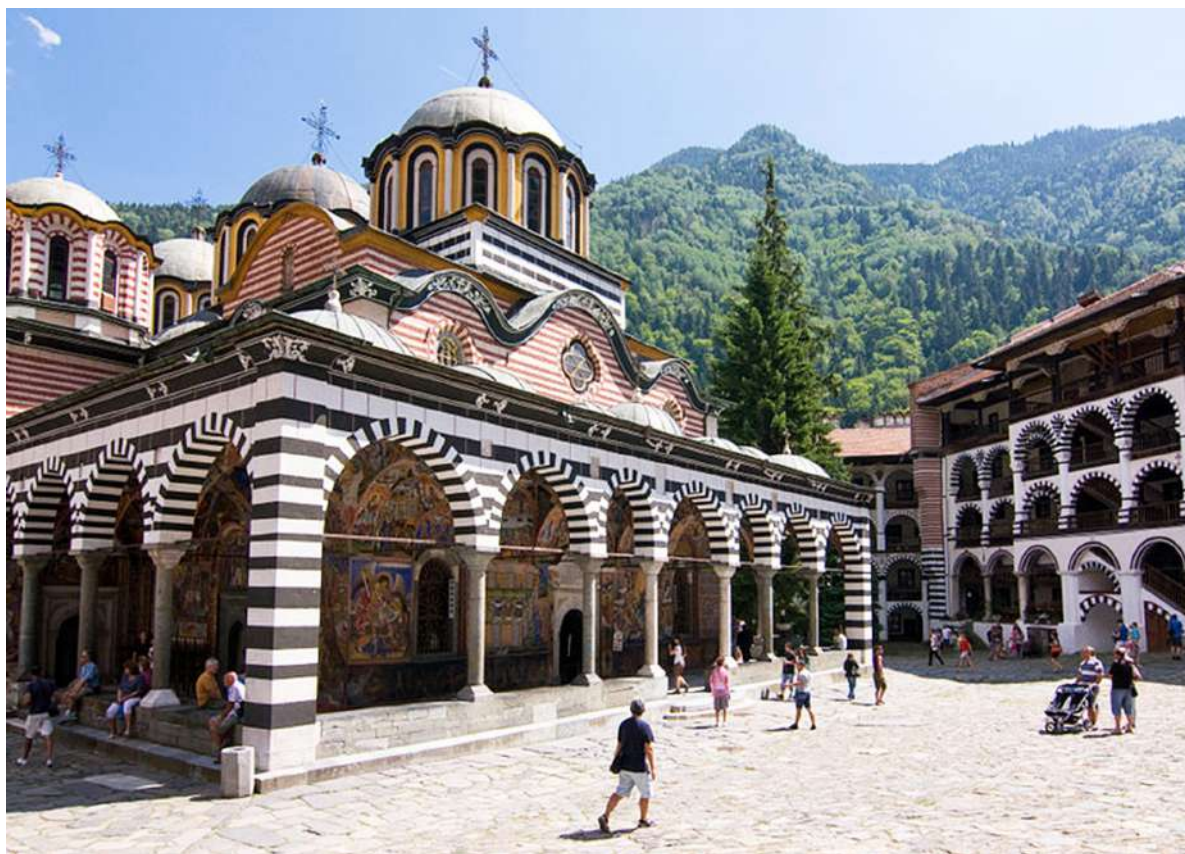
11. რილას მონასტერი Rila Monastery